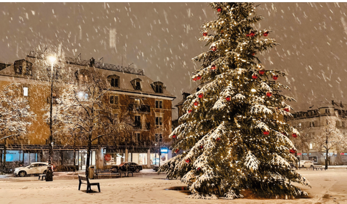
Weihnachtstanne auf dem Marktplatz